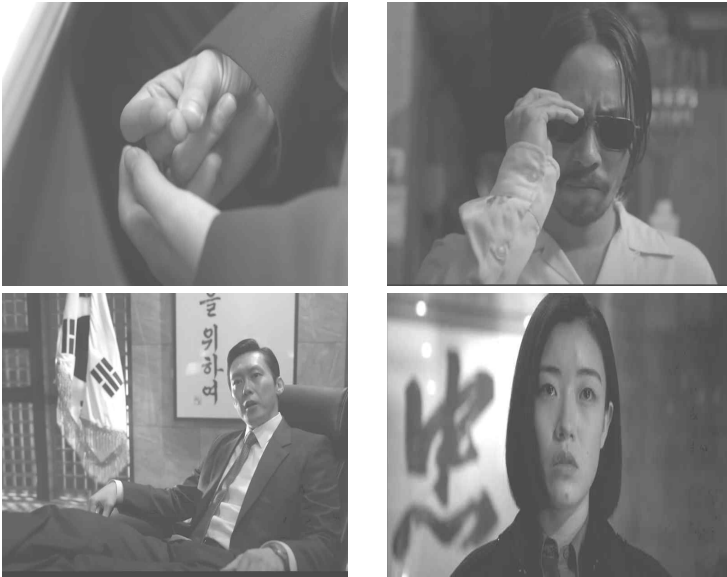
<사진 1> 시즌2 예고 장면

<무빙>은 선보인 20화만으로도 완결된 서사를 이룬다. 특히 안기부/국정원에서 초능력자들을 관리 감독하며 사건의 배후에 있던 민용준이 김두식에게 살해당하면서 일단락된다. 그러나 작중 곳곳에 후속작을 예고하는 장면을 배치해두는데, <타이밍>의 중심인물 김영탁이 시간을 멈추는 능력을 쓰는 장면과 장주원에 의해 죽은 줄 알았던 프랭크가 살아있다는 것, 민용준을 대신하여 자리에 오른 마상구, 그리고 학교 폭력 피해자였던 신혜원이 국정원 고위직에 위치하고 있음을 보여줌으로써 새로운 인물과 또 다른 사건이 있음을 암시한다. 마블에서 개별 작품 마다의 연계를 위해 쿠키 영상을 활용한 것처럼 <무빙> 역시 짧게 지나치는 장면을 통해 세계관 확장을 유도한다.